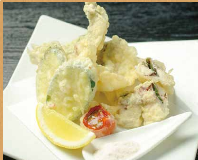
太刀魚の梅紫蘇はさみ天婦羅

太刀魚はDHA、EPAという良質な脂質を含んだ夏の旬の白身魚です。その太刀魚に梅しそを挟んで夏でもサッパリ食べられる天婦羅にしました。夏野菜とともにどうぞ。