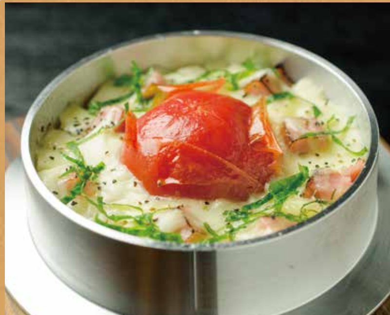
まるごとトマトとモッツァレラの釜めし

恵庭、千歳で獲れたこだわりのトマトとコロコロベーコン、そしてモッツァレラチーズを使用したちょっぴりイタリアンな釜めし。リコピン効果で美容にも期待できるかも!?