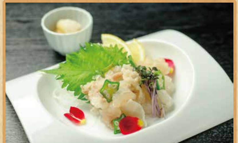
クジラの筋ポン酢

コラーゲンたっぷりのクジラの筋肉を柔らかくボイルしました。プルンッ、コリッ、シャリッな食感をお楽しみください。