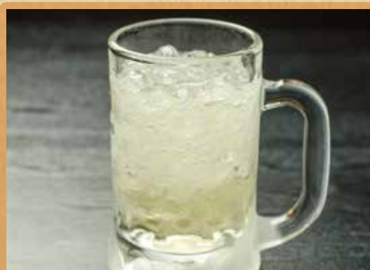
はちみつ梅酒のカチ割りソーダ